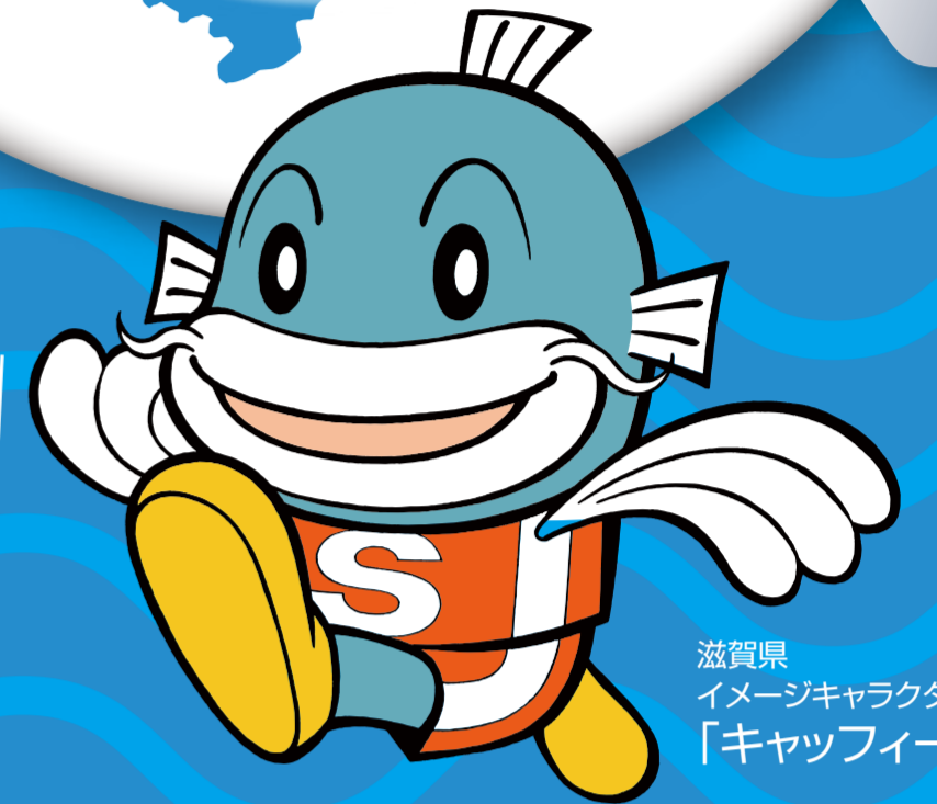
滋賀県 イメージキャラクター 「キャッフィー」